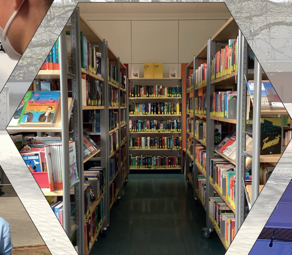
Lust auf Lesen